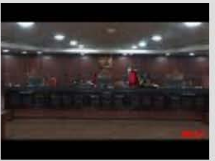
Sidang Perkara Nomor 64/PUU-XX/2022. Senin,...