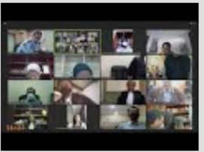
Sidang Perkara Nomor 63/PUU-XIX/2021. Selas...