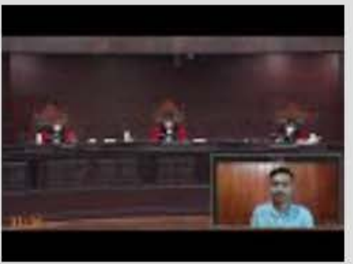
Sidang Perkara Nomor 63/PUU-XX/2022. Rabu, ...