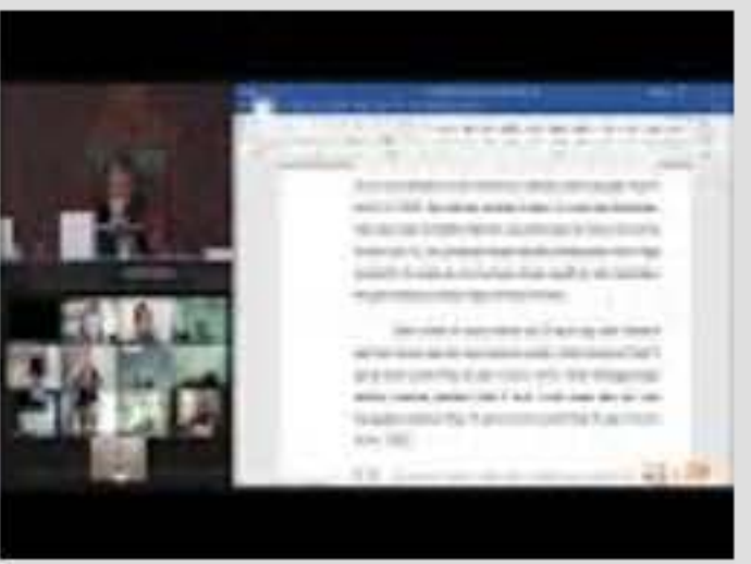
Sidang Pengucapan Putusan. Senin, 20 Juni 2...