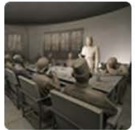
Pusat Sejarah Konstitusi