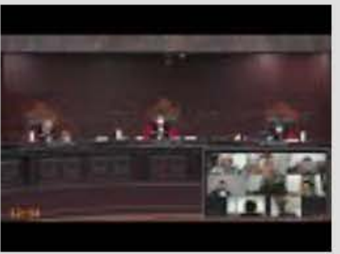
Sidang Perkara Nomor 62/PUU-XX/2022. Selasa...