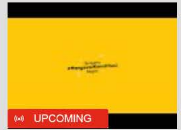
Sidang Perkara Nomor 65/PUU-XX/2022. Rabu, ...