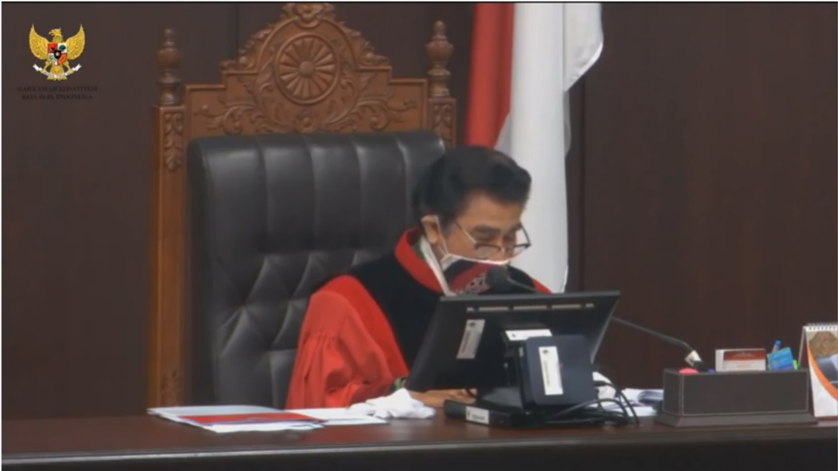
Sidang Pengucapan Putusan - Selasa, 19 Mei 2020