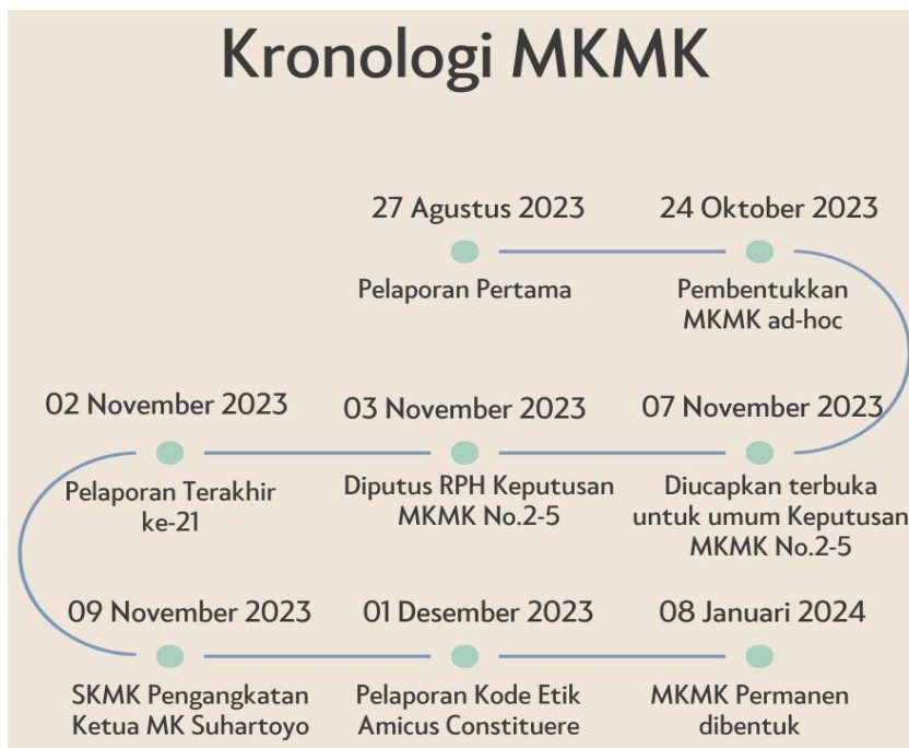
Bagan 1 : Infografis Kronologi MKMK ad-hoc hingga MKMK Permanen