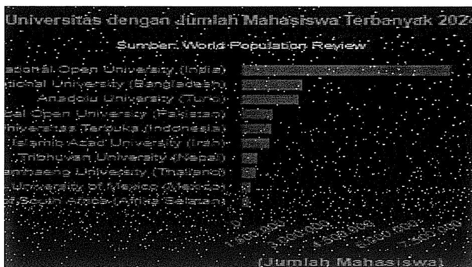
Tabel Universitas dengan Jumlah Mahasiswa Terbanyak 2024